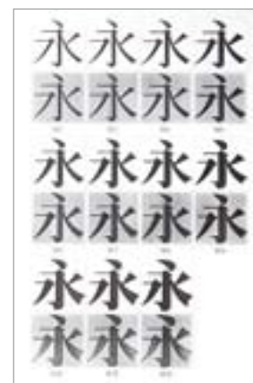
華康年代的測驗字體，當時已想有 W12 度的粗細設定。

「有很多人以為字體是從電腦中生出來的。實際上，這是一門極度辛苦的行業。開業的頭一、兩年，完全是零收入